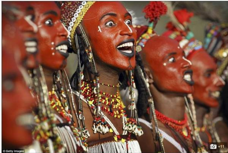
Culture: The Wodaabe believe bright eyes, white teeth and a sharp nose make a man beautiful - and the make up enhances these features