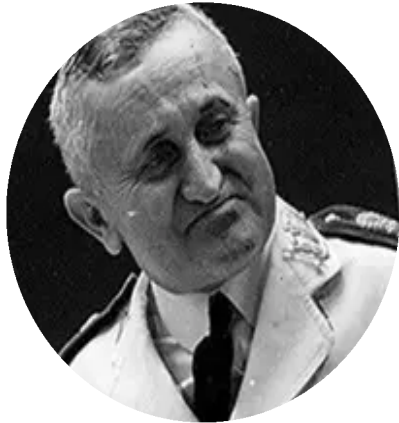
EURICO GASPAR DUTRA